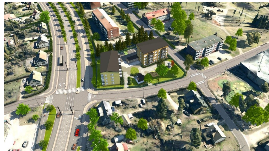
Havainnekuva yläviistosta lännen suunnalta.