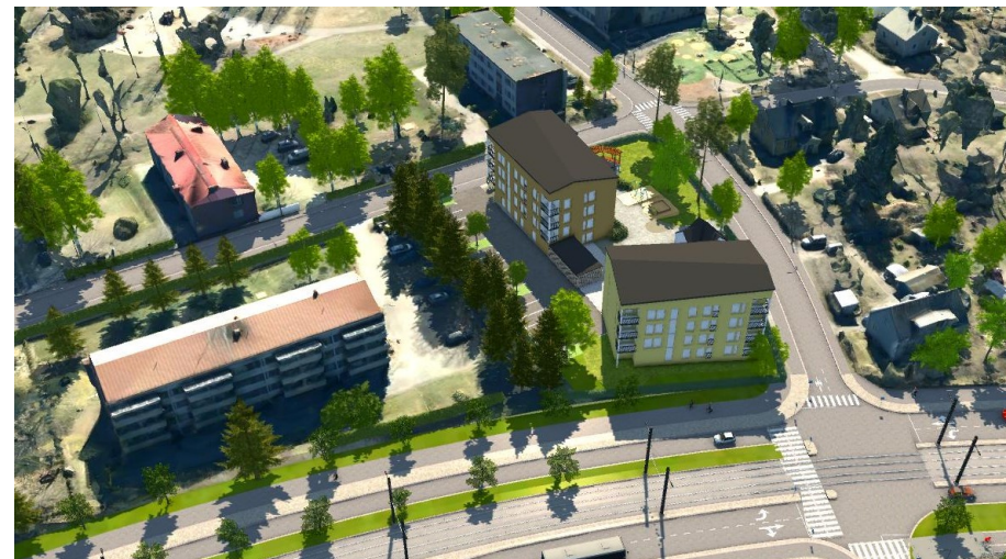
Havainnekuva yläviistosta pohjoisen suunnalta.

Hule-42(1) Kiinteistön vettäläpäisemättömillä pinoilla syntyvät hulevedet tulee ensisijaisesti imeyttää tontilla. Mikäli imeyttäminen ei ole mahdollista, tulee vettäläpäisemättömiltä pinoilta tulevia hulevesiä viivyttaa tontilla siten, että viivytyrakenteiden mitoitustilavuus on suluissa mainittu kuutiometrimäärä jokaista sataa vettäläpäisemättömää pintaneliometriä kohden. Viivytyrakenteiden tulee tyhjentyä 12 tunnin kuluessa täyttymisestään ja niissä tulee olla suunniteltu ylivuoto.