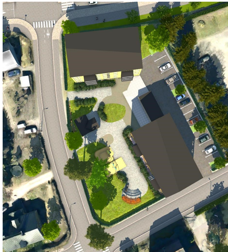
Havainnekuva suoraan ylhäältä.